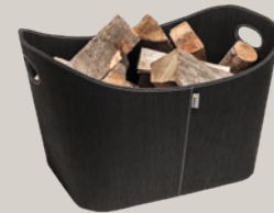
Aduro Baseline Holzkorb aus PET, schwarz